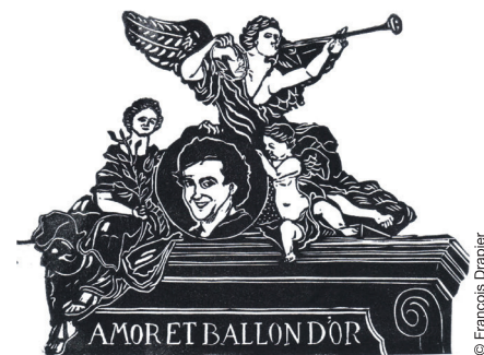
▲ Les pages du guide sont jalonnées de 60 gravures originales. Avec des monuments nancéiens, comme ici l'Arc Héré, parfois revisités.