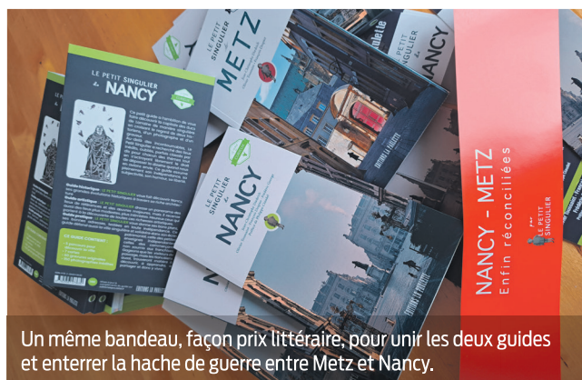
Un même bandeau, façon prix littéraire, pour unir les deux guides et enterrer la hache de guerre entre Metz et Nancy.

Édité par une MAISON INDÉPENDANTE , ce nouveau guide au format de poche assume une LIBERTÉ DE TON et une SUBJECTIVITÉ pour faire (RE)DÉCOUVRIR NANCY à travers des anecdotes, des personnages, des lieux emblématiques ou plus confidentiels.